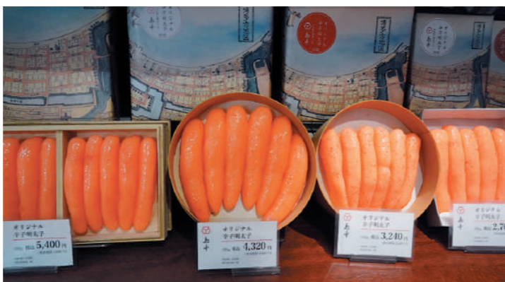
辛子明太子の商品

まず、会社の「在り方」を考えていきました。社員全員と面談や定期会議を開きました。「島本って何だろう」「どういう会社になりたいのだろう」。そして島本五つの誓いを策定しました。