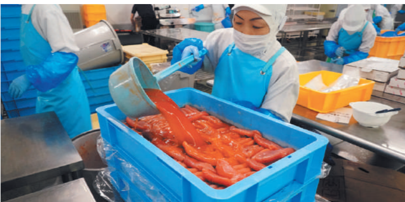
昔ながらの明太子の漬け込み

「 喜び創造会社 」。 敢えて「 喜び 」という文字を使っているのは、人をよるこぼせるという意味合