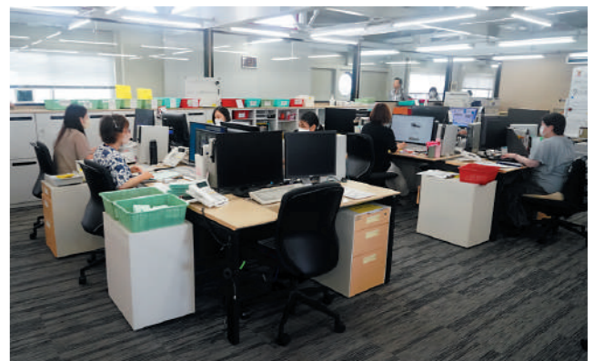
通販スタッフチーム

いがあるからです。現状の課題は「場所がない、時間がない、機械がない」という言い訳を、出来ない理由にしていたことです。そこで、できることを確実に実行しようという決意をしました。これを「有るを尽くす」という言葉で表してくれました。経営指針書を作成したからと言って、すぐに効果が出るものではありません。しかし進むべき方向性を成文化し、浸透させることで徐々によい方向に向かっていくのを実感しました。SWOT分析で、改めて自社の強みを再認識していきま