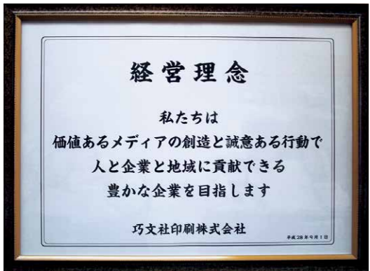
社内に掲示されてある経営理念

経営理念 私たちは 価値あるメディアの創造と誠意ある行動で 人と企業と地域に貢献できる 豊かな企業を目指します 巧文社印刷株式会社 同友会は失敗できる場所 同友会には知人の勧めで早くから入会していました。社長になって、改めて経営指針書を作成し、新しい経営理念を次のようにしました。