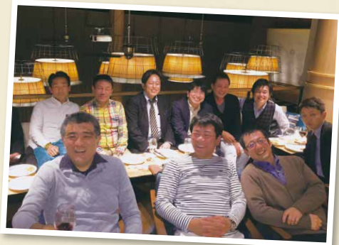
ドラゴン会の集まりの様子