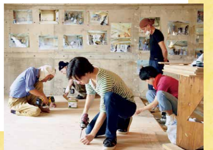
光ビル床はりの様子