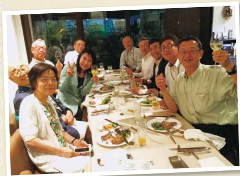
ダイヤモンドクラブの集まりの様子