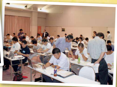
経営指針作成セミナー(2泊3日)の様子