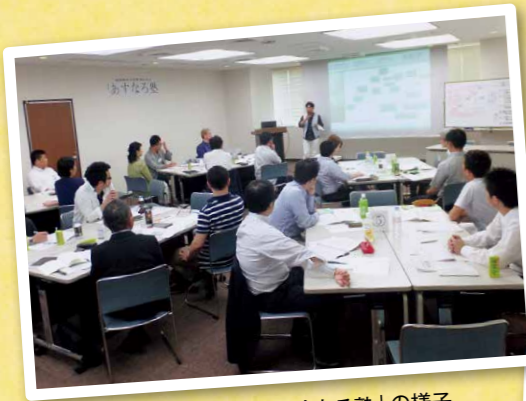
経営指針作成「あすなろ塾」の様子