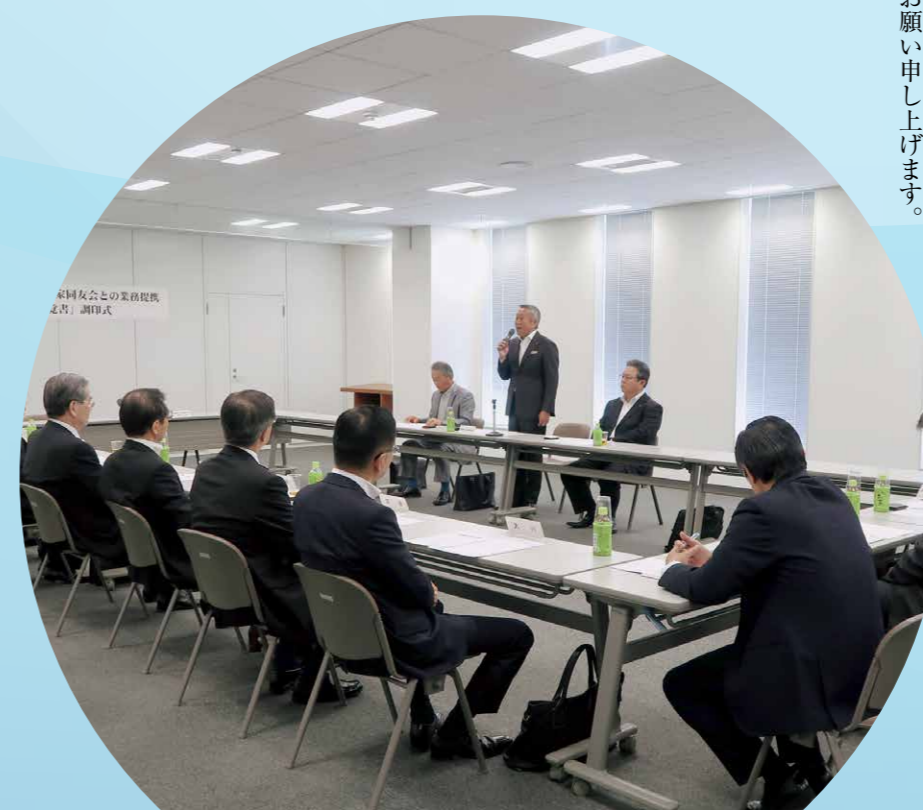
同友会との業務提携覚書 調印式

2016年10月20日(木)、福岡県内の8信用金庫と福岡県中小企業家同友会は「中小企業等支援に関する覚書」を締結しました。