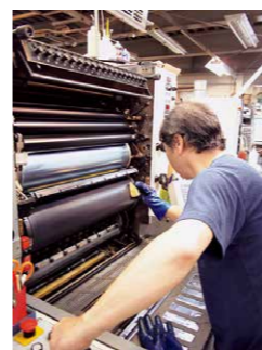
【今月の表紙】

巧文社印刷(株)には、昔から使っている機械がたくさんあります。機械のきれいな状態を見ると、職人さんたちが大切に使っているのが一目でわかります。この日も職人さんが使い終わった機械を丁寧に掃除していました。古い機械に対する職人さんの愛着も感じられました。