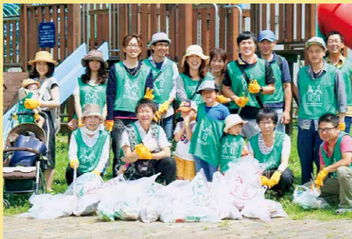
グリーンバードの活動

私たちの会社は、福岡県大牟田市で飲食店と不動産賃貸業を営んでいます。私が同友会に入会したのは、経営指針作成セミナー(2泊3日)に参加し、この経営の危機から脱出したいと強く思ったからでした。 あすなる塾に参加し、続けて経営指針作成セミナーに臨んだのですが、銀行への返済、入居率、などなど問題が山積し、理念どころではないというのが正直な気持ちでした。 『理念』、『方針』、『計画』。まず取り組んだのは『計画』です。3年後の目標を銀行の金利の交渉もしくは銀行借り換えに設定し、それまで決算書の見方もよくわかっていなかった私でしたが、どんな数字になれば、銀行がYESと言ってくれるのかを考えました。SWOT分析をもとに自社を分析し、『1の手』、『2の手』、『3の手』の順番でまず経費の削減。削減できた資金を元手に売上アップを目指しました。その際も、戦略の講義で学んだ『ベンチマーク』を参考に、同友会の中で先進的な取り組みをされている企業を訪問。リノベーションやカスタマイズ賃貸、DIYなど新しいことにも挑戦し、売上も徐々に上がりました。そしてついに目標にしていた、銀行借り換えができました。 しかし、入居率もあがり一安心した矢先、自社ビルの目の前は倒壊寸前の廃墟物件。通りも暗く怖いというお客様の声。そして日本創生会議から大牟田市の『消滅市町村』入りが提言されました。 「自分はなんのために仕事しているのか?」「自分が生まれ育ち、自身の子供が生まれ育つ街。なんと