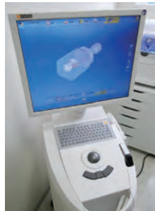
口の中を3Dカメラで撮影して映すモニター