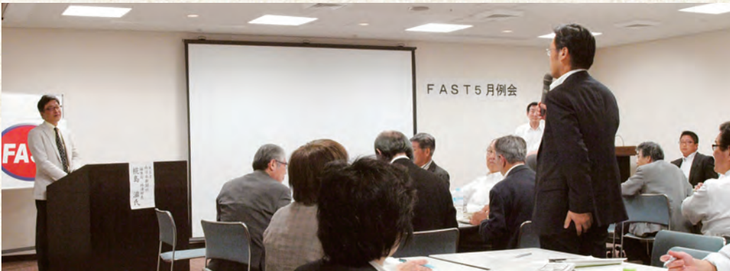
梶島氏への質問の様子

は支局が集めた記事で、福岡県に20の支局があります。九州経済に載せるほどの情報ではないが、地域の人に知っていたきたいという情報の場合は、支局の記者に連絡をとって、情報を送ったほうが、