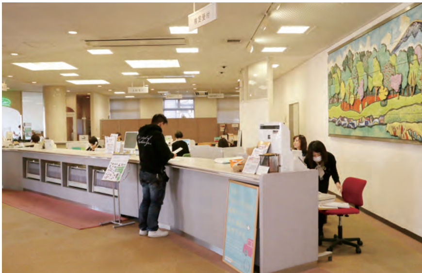
南福岡自動車学校内の事務所の様子