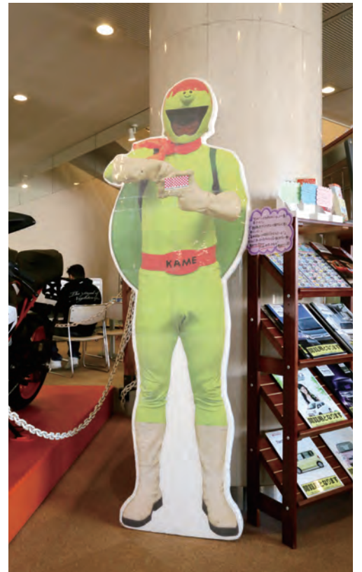
南福岡自動車学校のマスコットキャラ『かめライダー』

交通安全ヒーロー『かめライダー』というマスコットキャラクターを作りました。初代の口癖「ゆっくり走って長生き」の気持ちを込めま