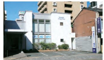
やまだホワイトクリニック歯科外観