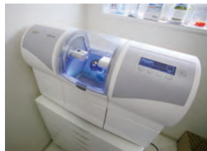
セラミックを削る機械(セレックシステム)

このことが自分自身の革新であると同時に院内の革新につながり「患者さんのため」、「自分の成長」、「院内のため」という3つの仕事観をスタッフ全員で共有し、現在のようないい和気あいの医院になったのです。