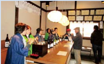
▲花の露酒造 角打ち

九州で最大の日本酒のお祭り「城島酒蔵開き」が2月14・15日久留米市城島町で行われました。