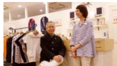
ソラリアプラザ店