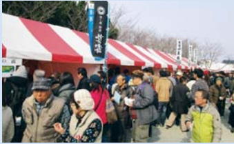
▲メイン会場 10時には人、人、人