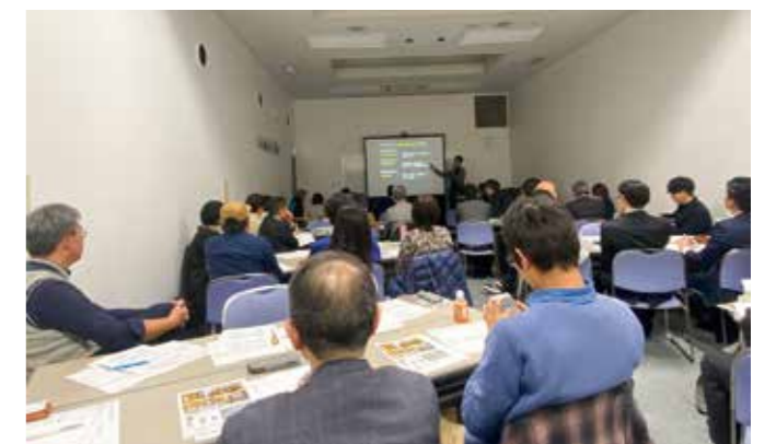
ソーシャルビジネス委員会2月例会の様子

社会問題がなくなることがないことも事実です。社会課題解決を事業の目的に位置づけ、ビジネスに結びつける能力を培うことができれば、社会が変化しても新たな事業を生み出すことができ、地域における企業の存在価値や信頼を高めることは、持続可能な企業活動につながります。ソーシャルビジネス委員会では、地域と豊かに生きるため中小企業を目指しこれからも学んでいきます。