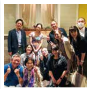
南支部すばる クラブコンサート