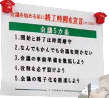
壁に貼られている会議5カ条

オフショア(海外に業務を委託すること)が進む中で英語力アップを目指してTOEIC