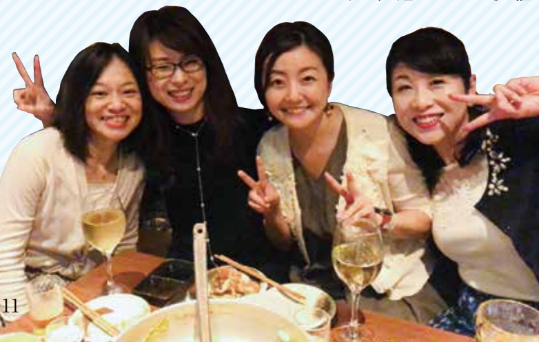
南支部の美女たち

そして2020年度は同友会を知る会の定期開催と、あすなる塾、経営指針作成二泊三日セミナーの参加を促すと同時に、ブロック会、例会の参加率を30%以上、女性会員比率のアップとともに、会員同士が積極的に「お互いの経営を語る」南支部を目標し、会員一丸となって同友会活動を行っていきます! ぜひ南支部に遊びに来てくださーいね!