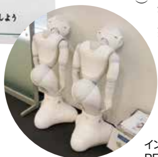
インターンシップまで出番を待つPEPPER君