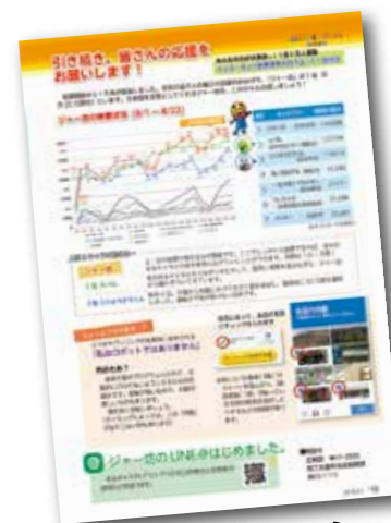
大牟田市のゆるきやら「ジャー坊」が暫定1位

また、現在大牟田市のジャー坊は「ゆるきやらグランプリ」に参加しており、市民・企業一丸となって1位獲得を目指し、同市をPRする活動を行っています。大牟田支部会員も関わり、企画・運営から当事業に携わっています。 2018年8月31日現在、214,697票で暫定1位となっております。ゆるきやらという存在で大牟田を知るキッカケづくり・同市への観光客の誘致、市民の結束を深めようと、ジャー坊の認知度UPやインターネットで日々一人ひとりがコツコツと投票しています。 地元地域が元気になれば、それに伴って地元企業も元気になる!逆に地元企業が元気になれば地元地域が元気になる!地域と共に成長していく同友会活動の一環として取り組んでいます。