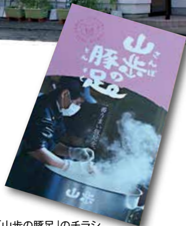
「山歩の豚足」のチラシ

に「明るい未来を創造する」と壁に掲示されていました。 強みは、「クリーニング」ではなく、「お客様とよく話すこと」と分析しています。『理念』から『自社の強み』を活かした戦略を立てるケースが多い