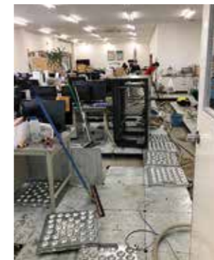
水が引いた後の片付けの様子(有田電器情報システム㈱)