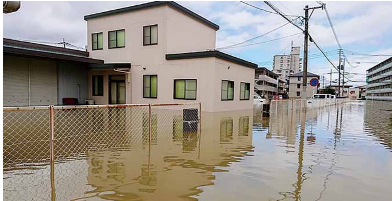
水で会社内に入れないほどに(共立包材㈱)