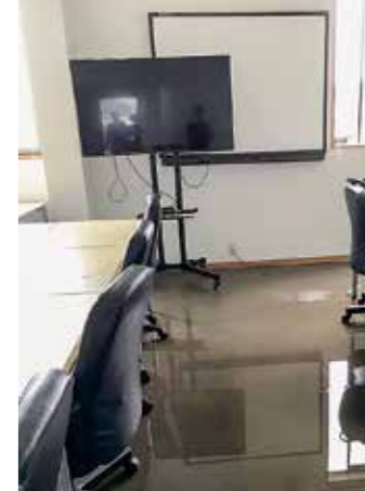
床上に浸水しオフィスが水浸しに(有田電器情報システム㈱)

7月7日(土)から8日(日)に社員25名全員が出てきてくれて、課長4名を中心に自分たちで作業を考えて処理してくれた。そのため、2日で復旧することができた。このことから経営指針の重要性を感じた。理念に「お客様のことを考える」とあるから、普段から意識が違う。得意先の被害も大きいたらうとみんな思い、月曜日から客先のPC復旧に行くために、自社を先に片づけた。