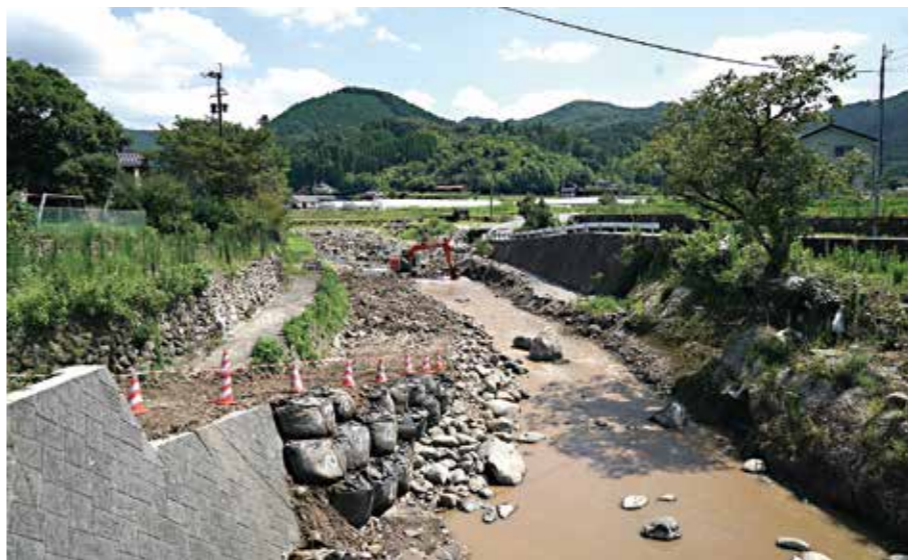
豪雨災害から1年経った今でも復旧作業が行われています

の配達です。うきは市の『山歩の豚足』が好評で、委託販売でお客様に届けて喜ばれています。「人口が減少しても、お客様の生活すべてに関わること地域に生き続けていけると考えています。自分だけ大きくするのはなく『身の丈を知ること』を信条にしています。「そのためには健康第一です。身体を壊しては元も子もありません。理念に続くコンセプトには、「しっかりと休む」とありました。