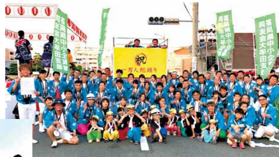
おおむた大蛇山まつり・一万人の総踊りに参加