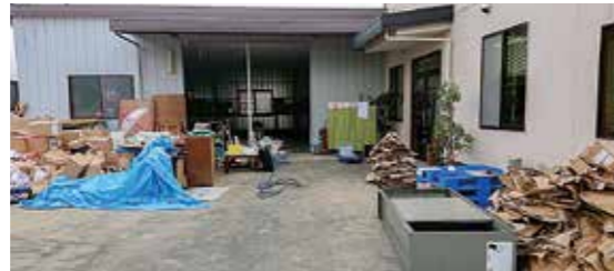
後片付けでは多くのゴミが出た(共立包材㈱)