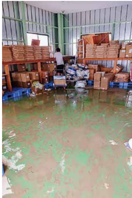
倉庫の浸水被害の様子(共立包材㈱)

西日本豪雨で被害に遭われました皆様に、心よりお見舞い申し上げます。 九州北部豪雨からちょうど1年、いまだその傷跡がいえぬ福岡で、 7月6日(金)に再び大雨による災害が発生しました。 当日は昼過ぎから交通機関がマヒし、その影響は土日も続きました。 福岡同友会では7月9日(月)に、代表理事の談話として被災企業へのお見舞いと 被害状況の集約を会員全員に発信し、事務局員全員で会員の安否確認を行いました。 その結果、建物の床上浸水16社、工場や倉庫などへの浸水7社など、 直接被害にあった会員が多いことが判明しました。