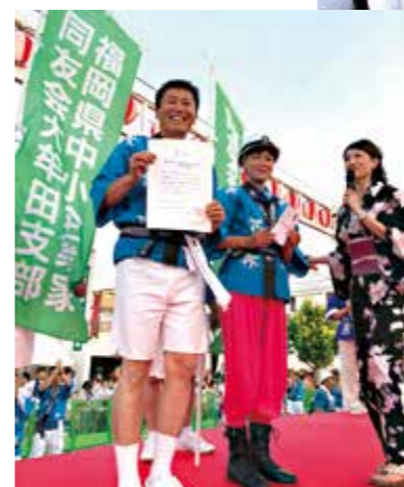
高得点を獲得し、見事3位入賞

本年は近隣地域の荒尾市盛り上げ隊・炭鉱ガールズとコラボして、踊り・隊列・企画力の各項目で高得点を獲得し、3位入賞という結果を勝ち取りました。