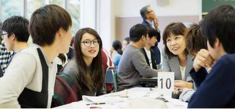
学生と経営者が一緒になって話し合います