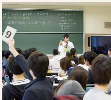
積極的に意見が飛び交うグループ発表

「中小企業のほうが社長との距離が近くて楽しそう」、などの発表がありました。このような発表が多いことは毎年参加する我々の喜びでもあります。自発的に発表する姿勢の子にはぜひ個別にインタビューシッパなどでのアプローチをしたいと思います。