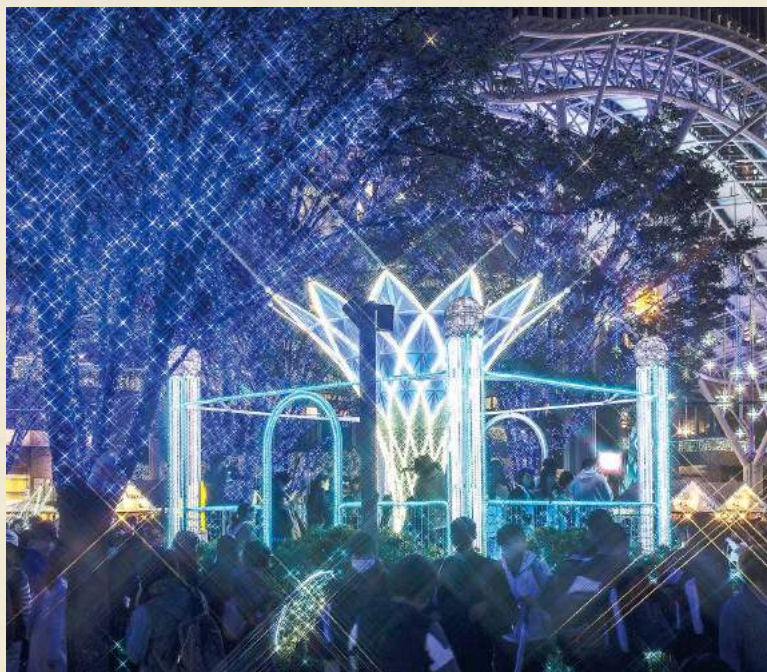
見上げる顔はみんな笑顔