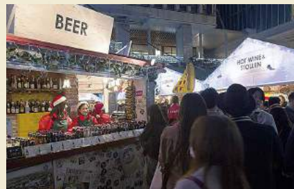
本場ドイツビールも出店