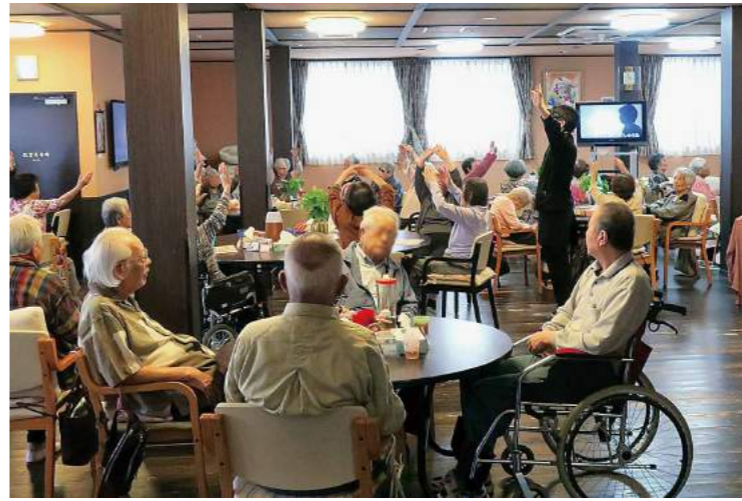
おやつ前の体操の時間

多くの介護事業者は改正ごとに振り回されてもがいているのが現状です。グループ内では違う業種、すなわち建築・計画・デザイン、さらにコンサルティングをパッケージにした会社、アイコムズ株式会社を立ち上げ、ここで収益をグループに還元しています。「事業は収益がなければ継続・拡大できません。すべては介護事業を守り、さらにすべての人が幸福と豊かさを実現させる福祉のためです。福祉の「コト」づくり企業と位置付けています。不動産、飲食に広がり、今後も更なる展開を見込んでいます」