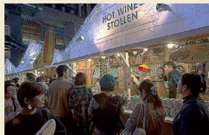
開店待ち切れずフライングでオープン