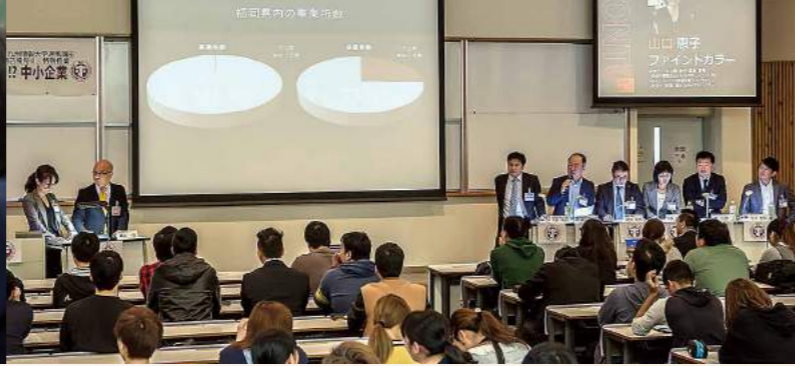
パネラーたちから披露される話に大盛り上がり