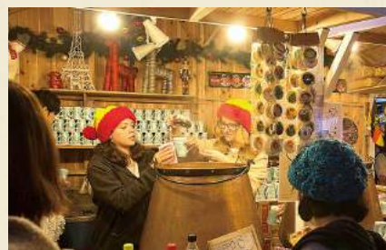
オリジナルカップにホットワインを