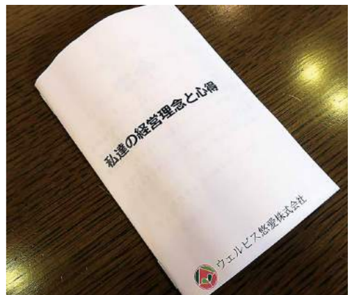
幹部社員全員が持つ幹部の行動指針10ヶ条