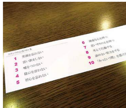
スタッフ全員が持つクレドカード