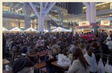
大勢の人でにぎわう会場