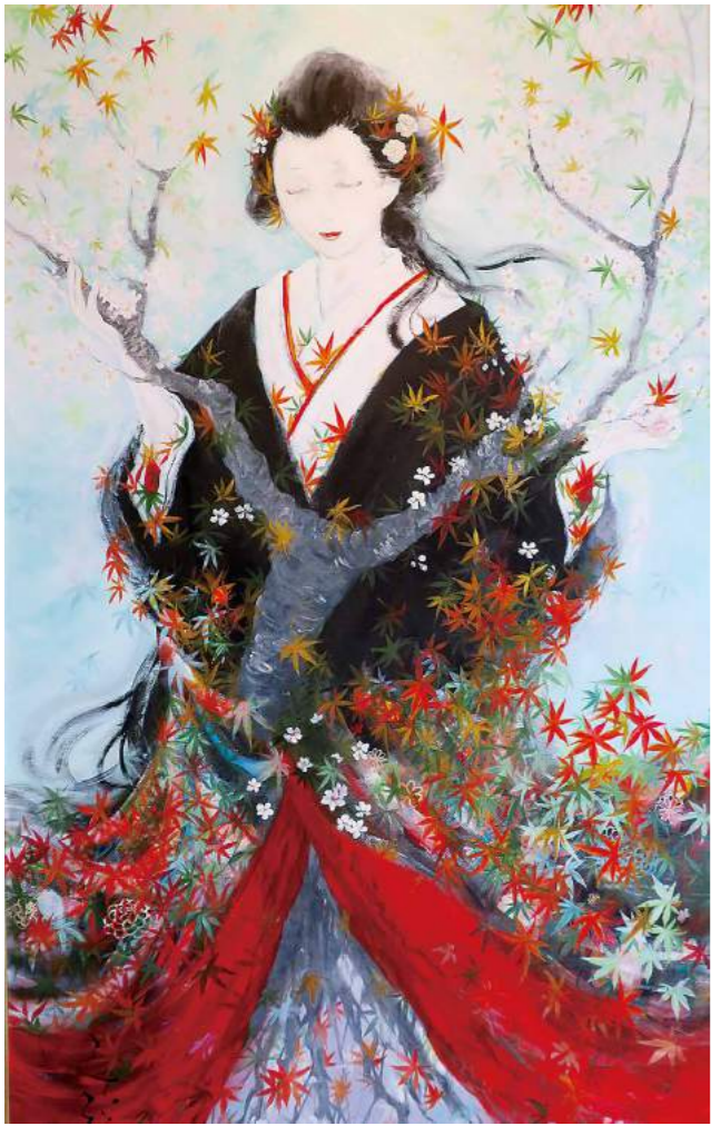
理念を基に描かれた絵

私たちが目指すのは介護事業を通して すべての人に共通する幸福と 心の平安を追求することです。