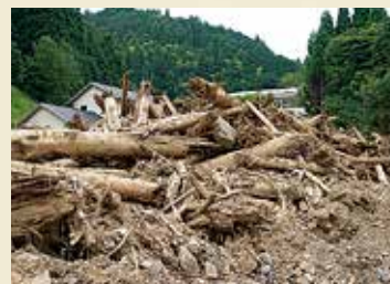
東峰村 散乱する流木と土砂