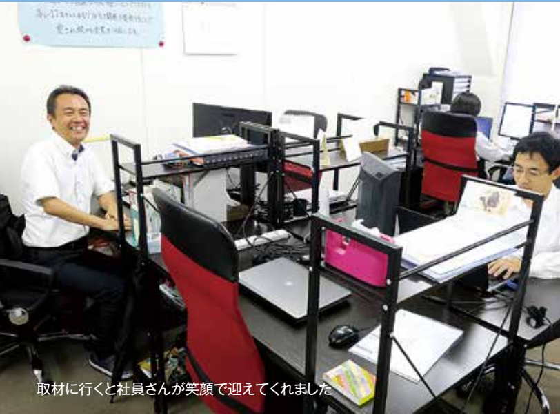
取材に行くとき社員さんが笑顔で迎えてくれました