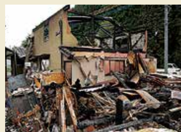
東峰村 落雷による火災現場