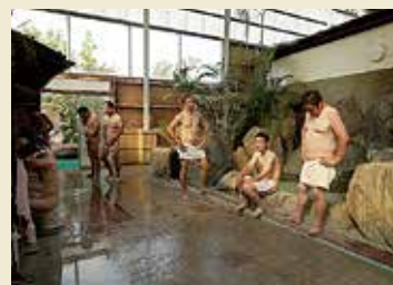
原鶴温泉 やぐるま荘で入浴するボランティア・スタッフ