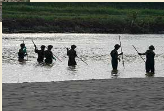
筑後川 不明者の捜索にあたる自衛官たち