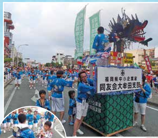
長さ約10m、高さ約3m、重さ最大3トンもある何台もの大蛇山の山車が、火煙を吐きながら街を練り歩く姿は圧巻です。

大牟田市制100周年記念行事として行われた本催事。これまでの100年とこれからの100年が変わる、記念すべき年の、記念すべきまつりとなりました。