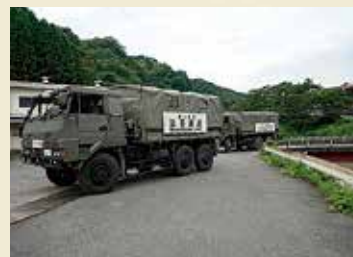
東峰村 災害派遣の山形の第6後方支援連隊車両