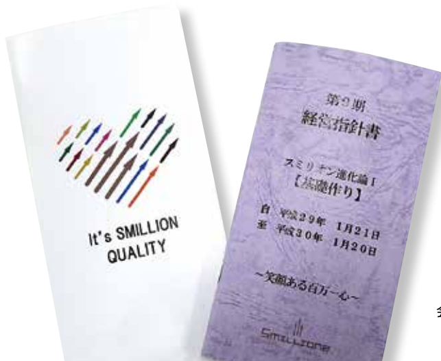
会社案内(左)と経営指針書(右)

「いろいろな勉強会に参加してきましたが同友会が私にとってドン・ピシャでした。同友会に入ったからには経営指針書を作成しなければならぬと思いました」 入会して7月には理念作成の『あすなる塾』、8月には『経営指針書作成セミナー』に参加しました。なんとか作ってはみたものの、独りよがりもしいところで、社内で発表もしませんでした。それでも自分なりに気づいたことはメモして肉付けしていくのでした。そして翌年、社内で発表してみました。 「同友会で聞いていた通り、社員たちは『ふくん』っていう反応でした」と苦笑します。いつでも社内で回覧・閲覧できるように共有の棚に置いておきました。誰一人見た形跡はありませんでした。 どうしたら社内で理念を共有できるかを模索しながら、同友会の例会や委