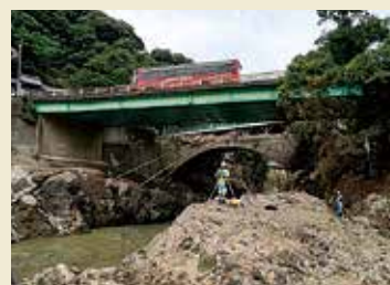
大肥橋 流木が橋につき刺さっている