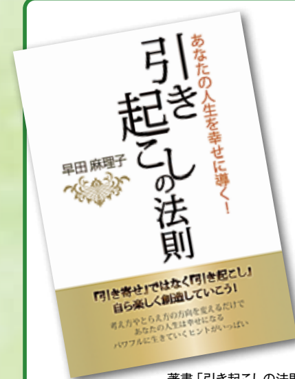
著書「引き起こしの法則」(2016年出版)