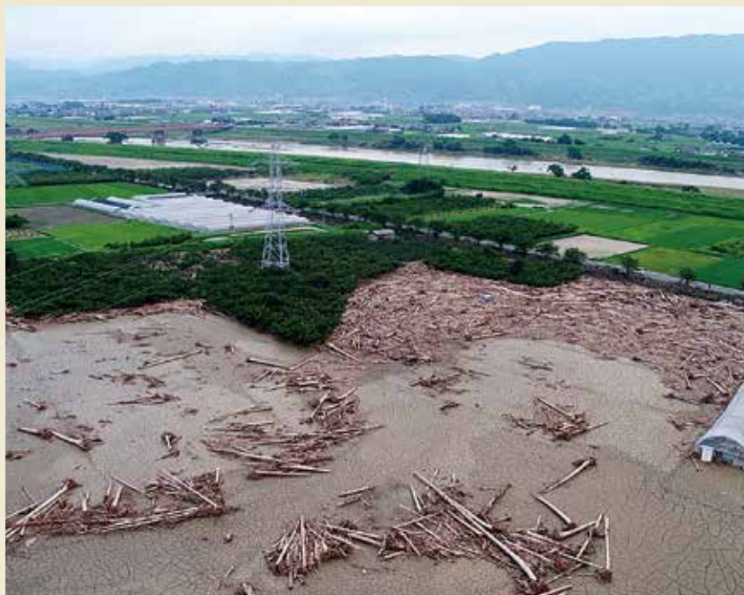
三連水車の付近(ドローン空撮)